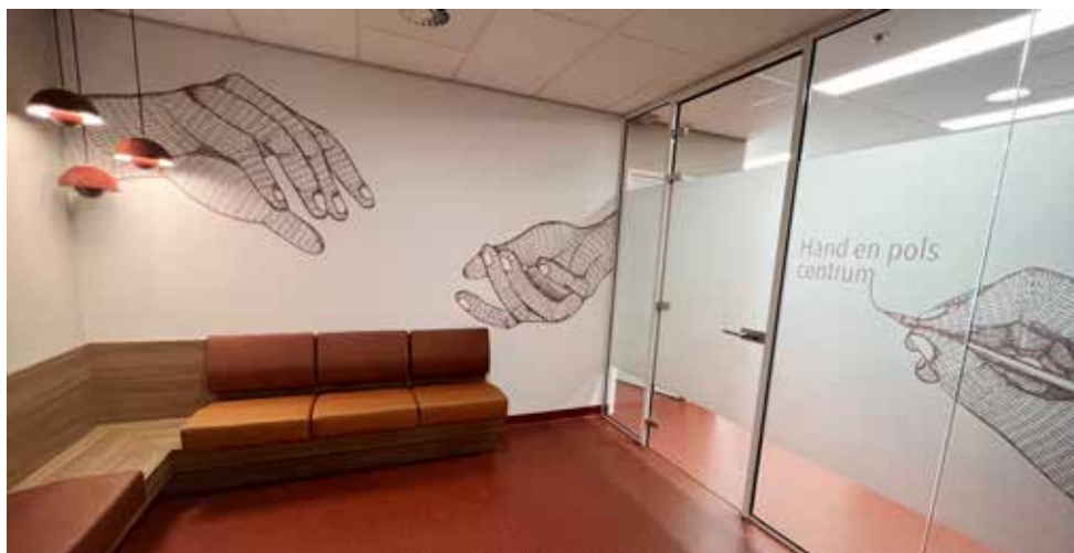
De wachtruimte van het hand- en polscentrum.