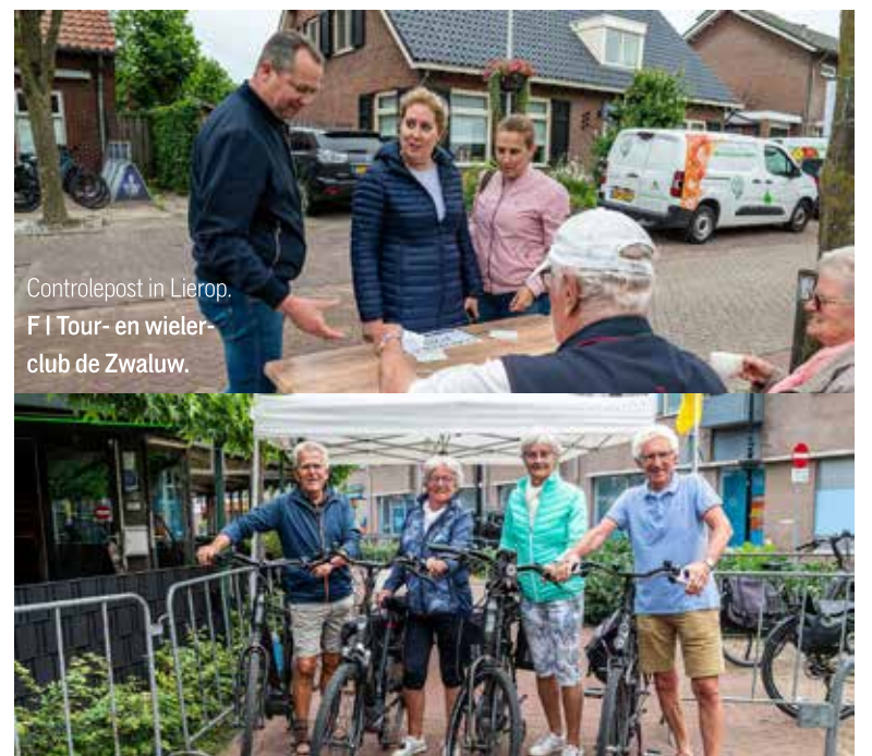
Controlepost in Lierop. F I Tour- en wielclub de Zwaluw.

Jongerenvereniging JOEK uit Someren organiseert ieder jaar een wandeltocht van 80 km, waar de lopers 20 uur over mogen doen. Toen JOEK deze tocht voor de 20e maal organiseerde, hebben zij deze tocht, een week voorafgaande aan de wandelmars, ook als fietstocht georganiseerd. Ten eerste natuurlijk om hun jubileum te vieren en om de mensen die niet mee lopen, maar die toch nieuwsgierig waren naar de route, ook de gelegenheid te geven deze 80 km af te leggen. Daarna heeft Toerclub de Nachtegaal de organisatie op zich genomen en maakte van de fietstocht onder de naam Kennedy-toertocht een terugkerend evenement. In 2004 heeft de Nachtegaal de organisatie overgedragen aan TWC de Zwaluw. Dit jaar is het voor het JOEK al de