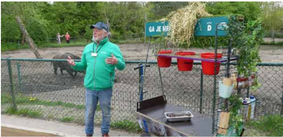
Vrijwilligers dragen bij aan educatie en bewustwording van dierenwelzijn.

MIERLO Stichting Wildlife in Dierenrijk is op zoek naar nieuwe, enthousiaste vrijwilligers, die het leuk vinden om samen met een gedreven team van Stichting Wildlife te werken aan educatie en bewustwording van dierenwelzijn. De taken bestaan onder andere uit het geven van rondleidingen en begeleiden van kinderfeestjes.