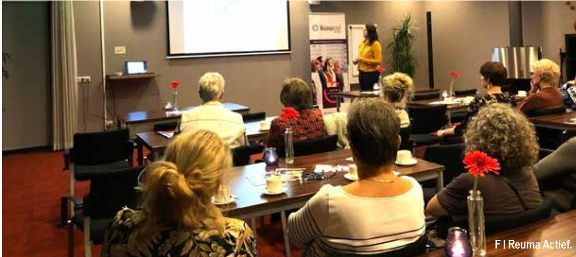
F | Reuma Actief.

REGIO Tegenwoordig best bijzonder; landelijk gezien worden de een na de andere patiëntenvereniging opgeheven. Bij de een daalt het ledenbestand drastisch, bij de ander is er te weinig animo om een bestuursfunctie te vervullen. Bij de vereniging Reuma Actief de Peel heersen deze problemen niet.