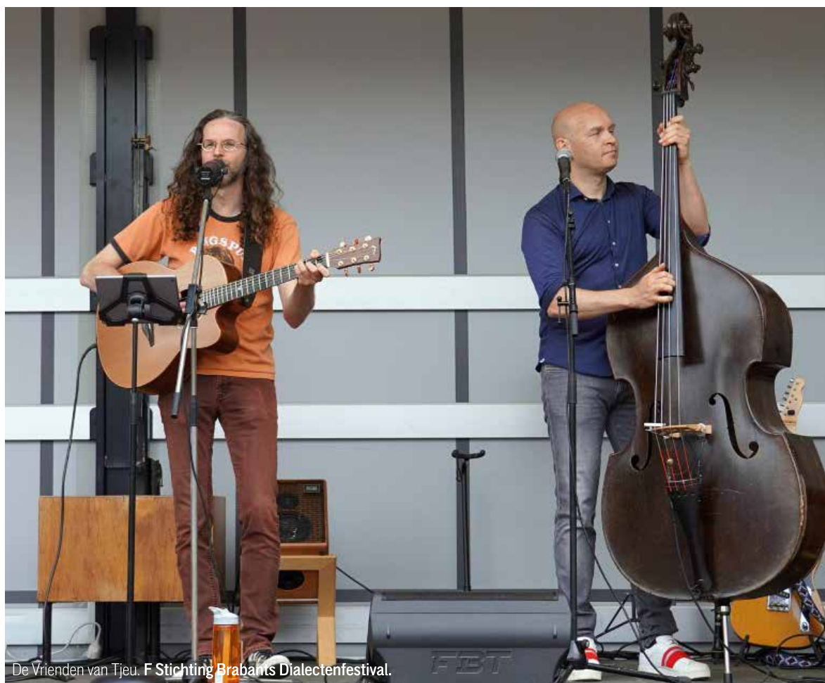
De Vrienden van Tjeu. F | Stichting Brabants Dialectenfestival.