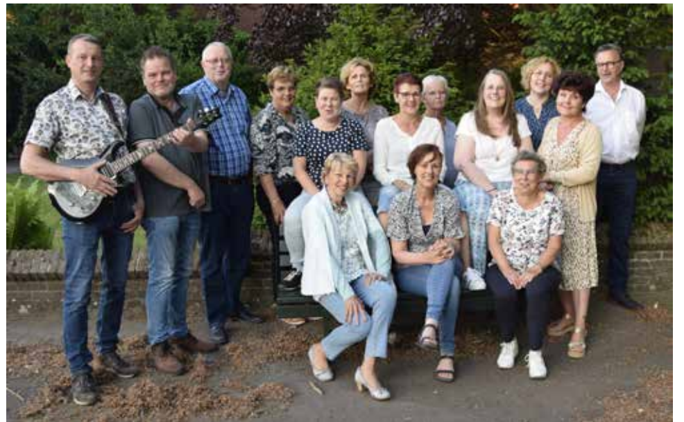
Zanggroep Generation. F | Eric Kouijzer.

MIERLO Op zondag 25 juni 2023 organiseert zanggroep Generation een koffieconcert in samenwerking met zanggroep Joko uit Mierlo. Een gezellig concert waarbij de koffie klaarstaat. Dit concert vindt plaats in 't Patronaat te Mierlo en begint om 10:30 uur.