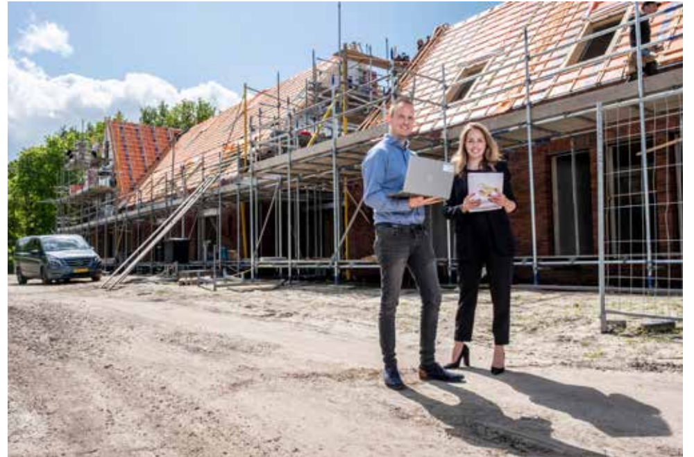
F | Rabobank.

Een nieuw platform is CrowdBuilding, waarvan Rabobank partner is. "Het idee is om collectieve zelfbouw voor iedereen toegankelijk te maken. Zo verbindt het gemotiveerde woningzoekers